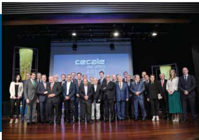
CECALE de Oro