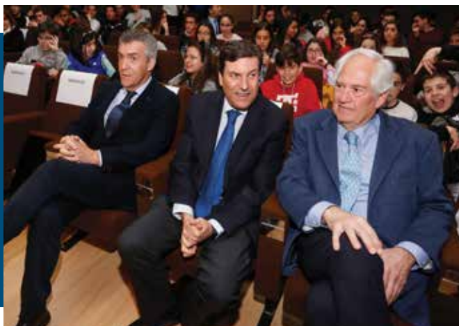
Entrega de los XV Premios Escolares de Prevención