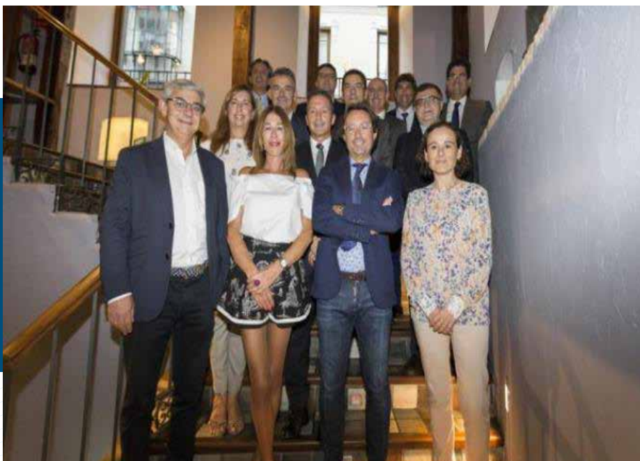
CECALE, en el jurado de los Premios Castilla y León Económica