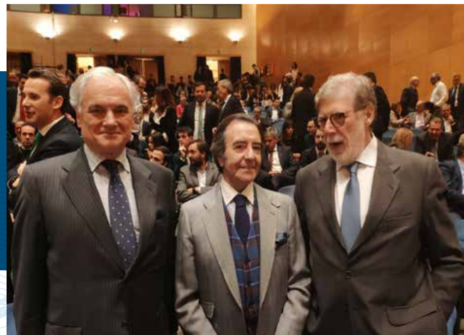
XIII Premios Castilla y León Económica