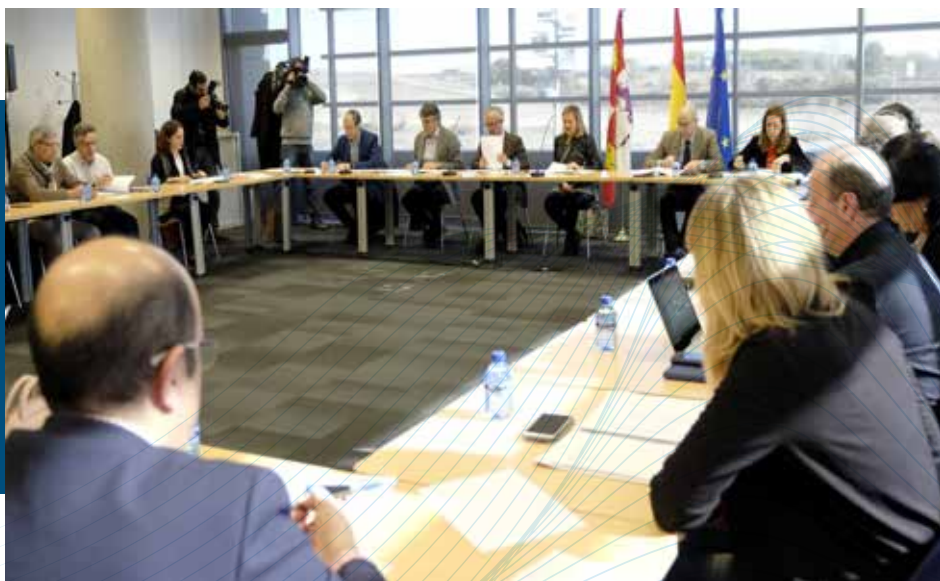
Reunión sobre el Plan de Dinamización de Municipios Mineros