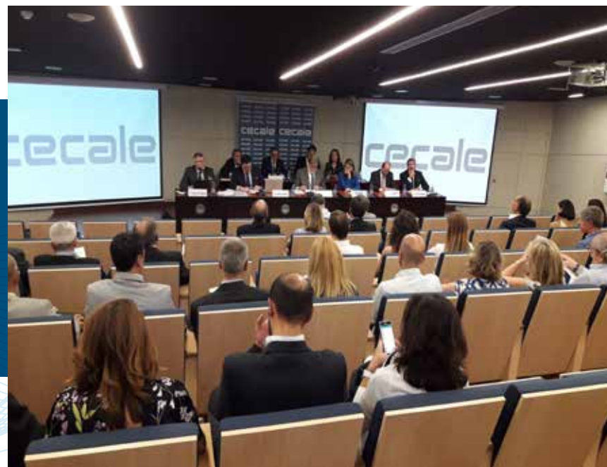
Asamblea General de CECAL