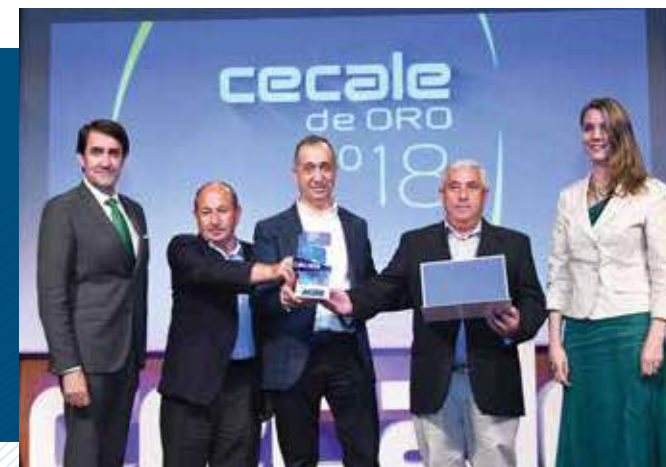
CECALE de Oro (Valladolid)