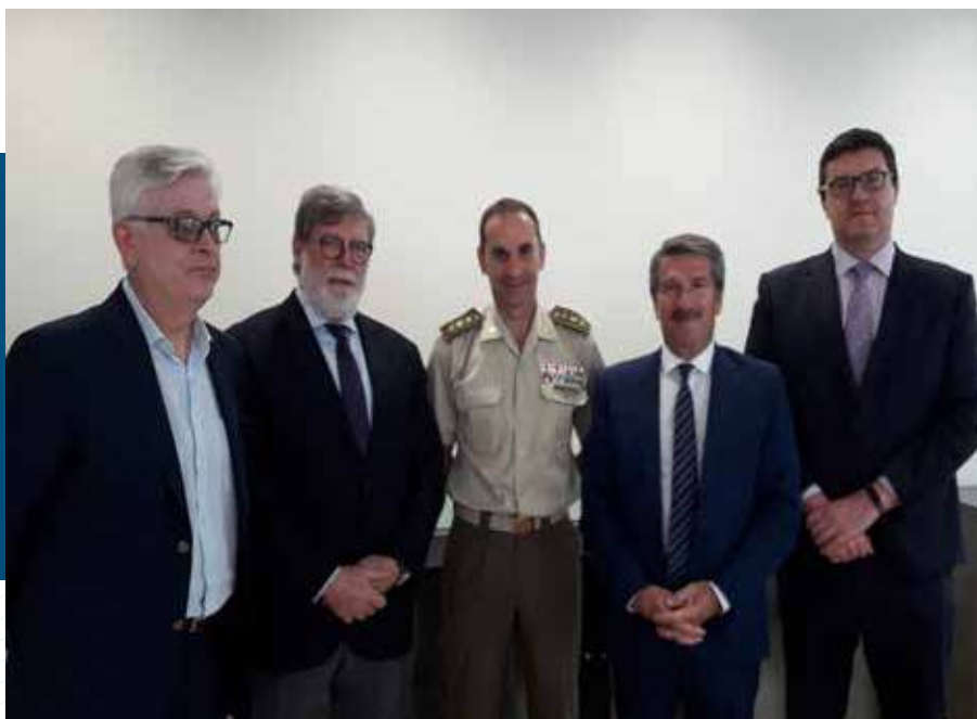
Reunión con el delegado de Defensa en Castilla y León