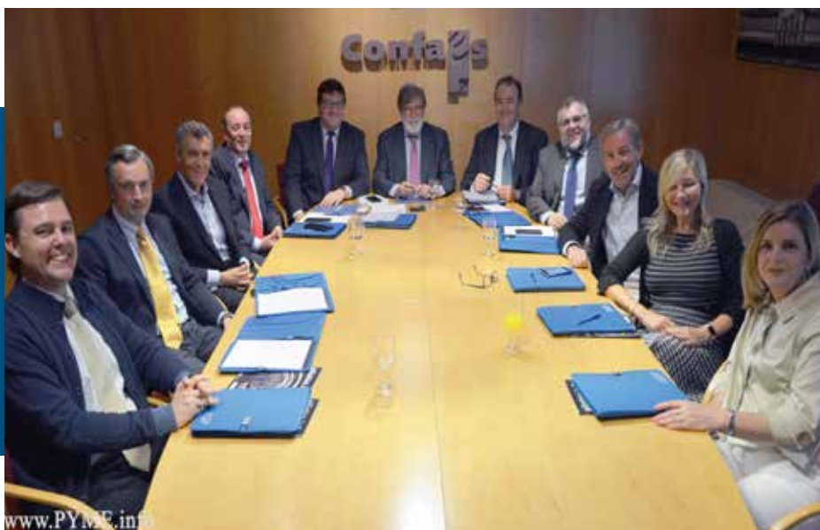
Reunión de la Junta Directiva y el Consejo Estratégico Sectorial de CECALÉ, en la sede de CONFAES