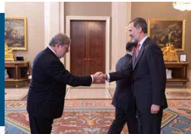
Su Majestad el Rey recibe al Comité Ejecutivo de CEOE.