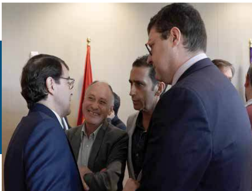
Acto de investidura de Alfonso Fernández Mañueco