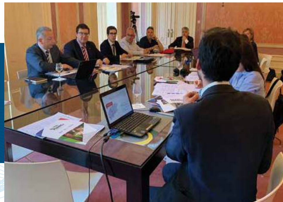
Mesa de Diálogo Social Transfronterizo sobre el Sector del Automóvil