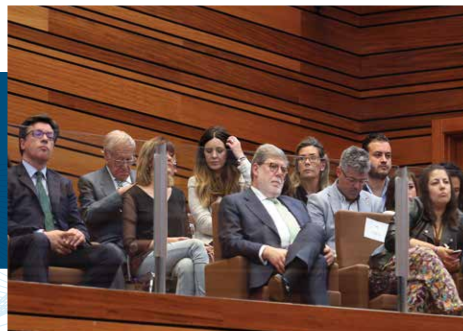
Sesión constitutiva de las Cortes de Castilla y León