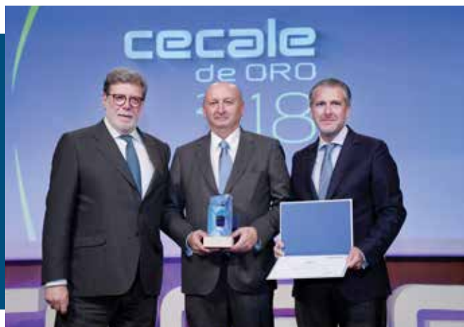
CECALE de Oro (Segovia)