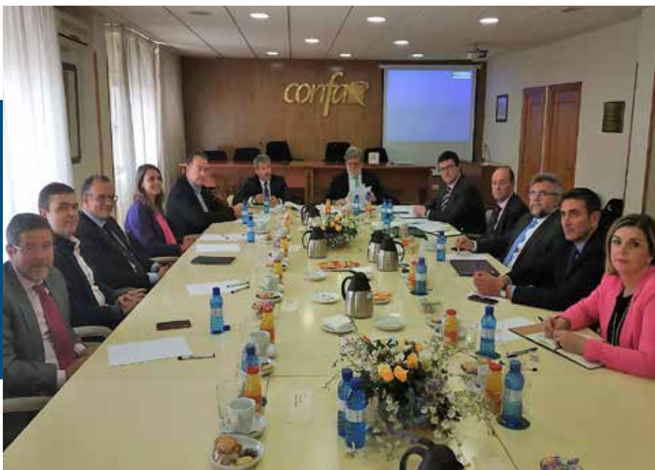
Junta Directiva de CECALÉ en la sede de CONFAE