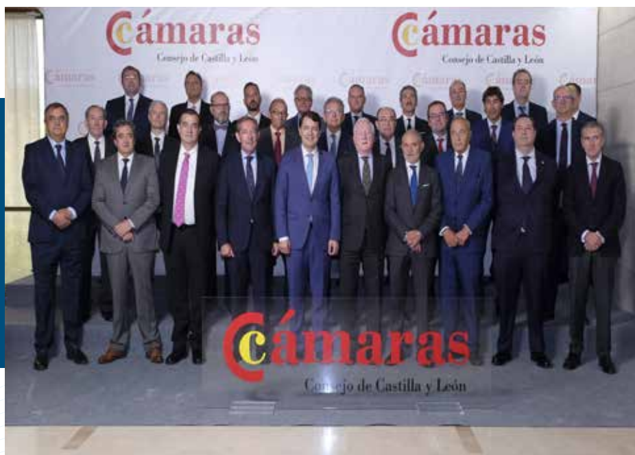
CECALE, en el Consejo Regional de Cámaras de Comercio de Castilla y León