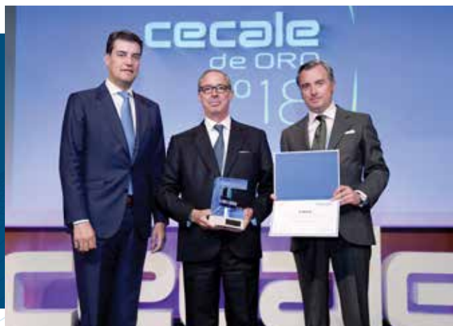
CECALE de Oro (Soria)