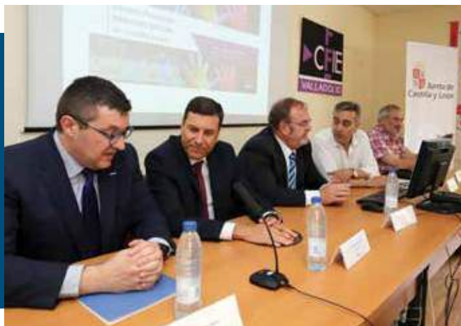
La enseñanza del Diálogo Social entre escolares y docentes de Castilla y León