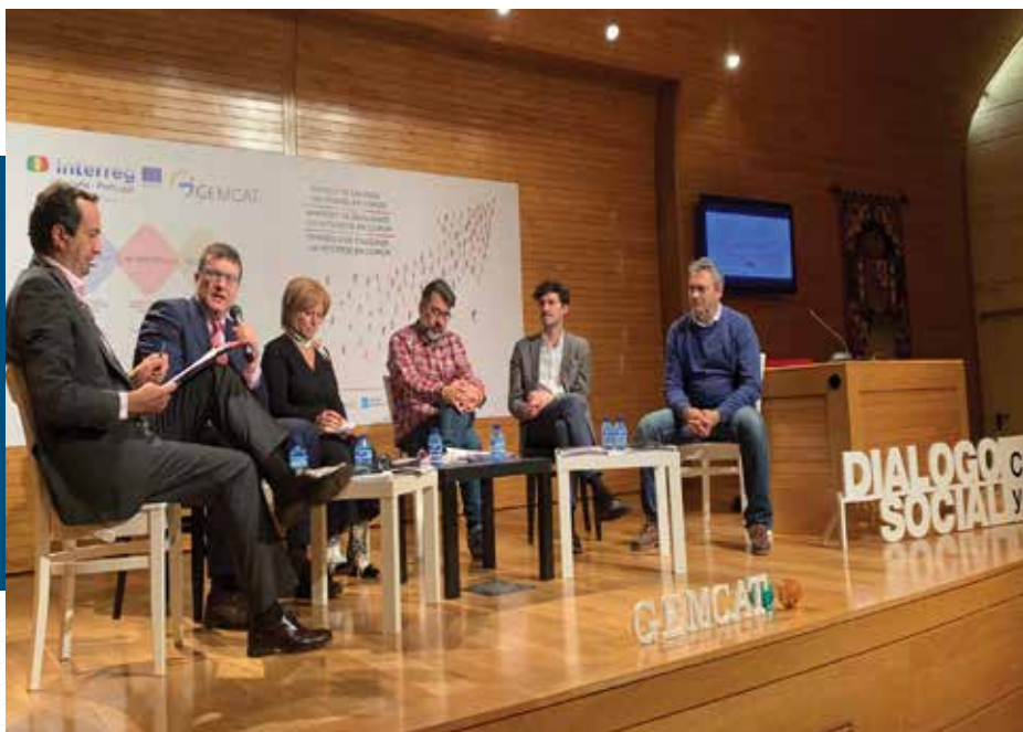
Foro de Diálogo Social Transfronterizo del Sector Automoción