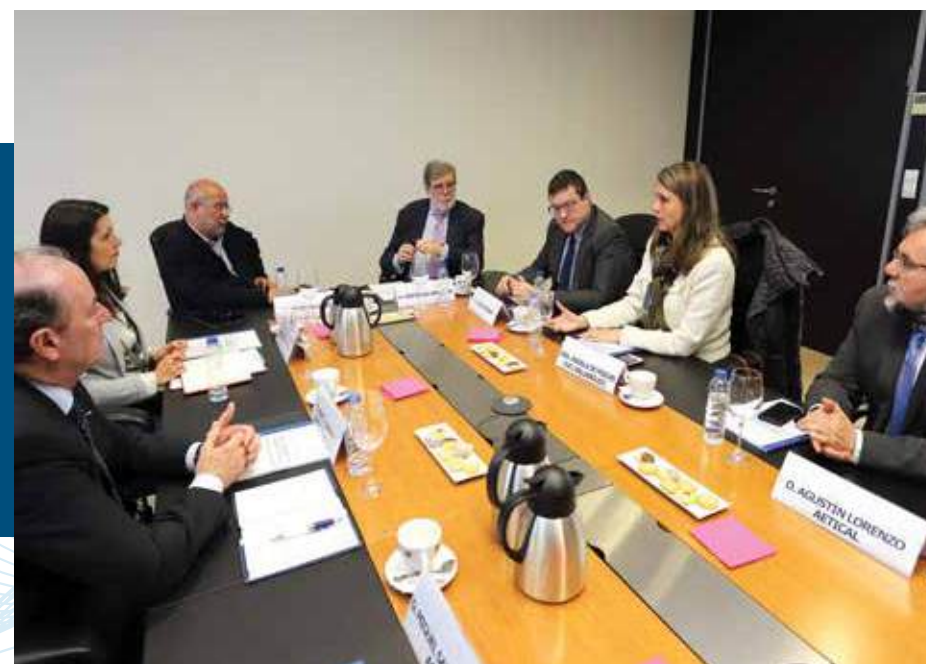
CECALE traslada a Ciudadanos sus planteamientos empresariales