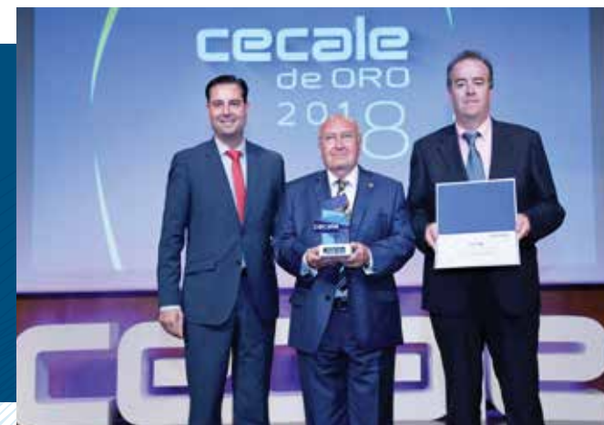
CECALE de Oro (Salamanca)