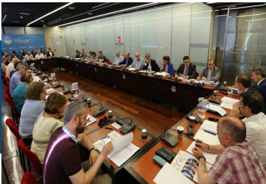
Aprobación del informe anual del CESCyL de 2018