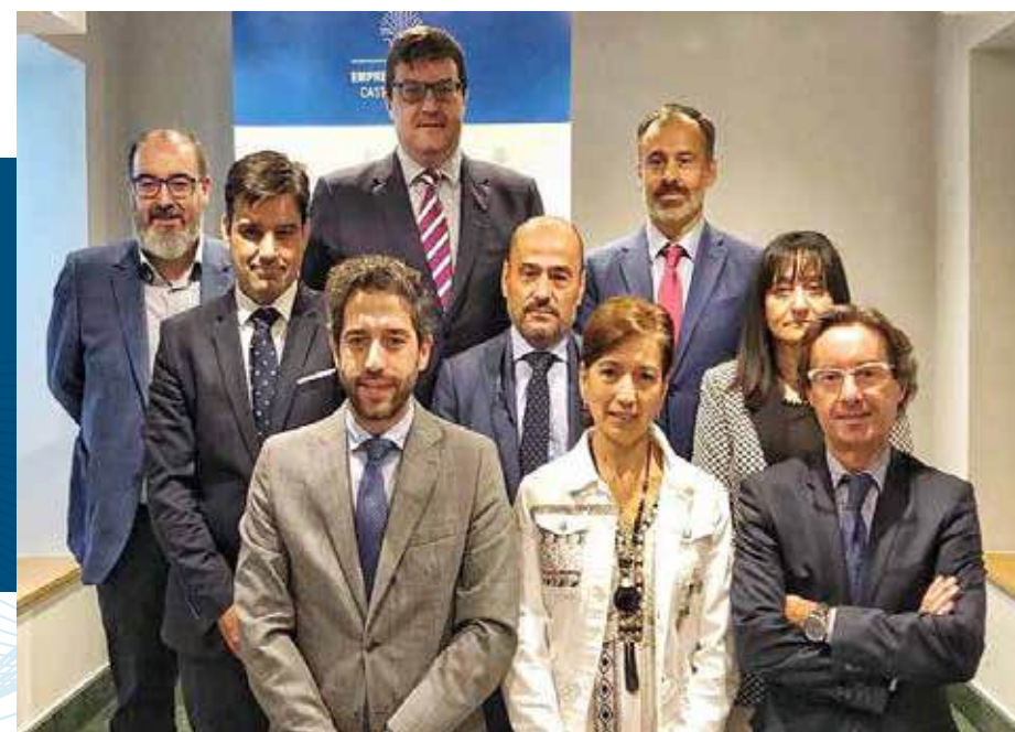
Jurado del Premio Familia Empresaria de Castilla y León