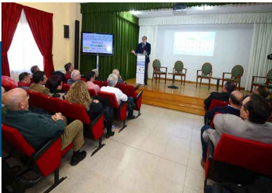
Congreso sobre la economía del Bierzo “Abrazando el futuro”