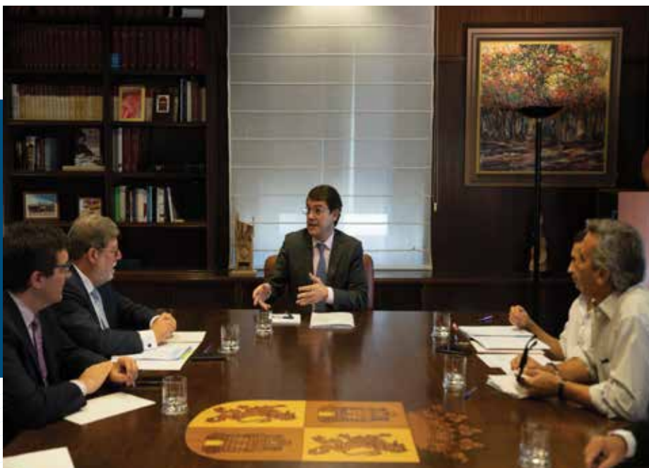
Apuesta decidida del Gobierno regional por el Diálogo Social