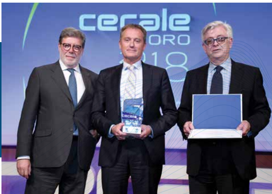
CECALE de Oro (Zamora)