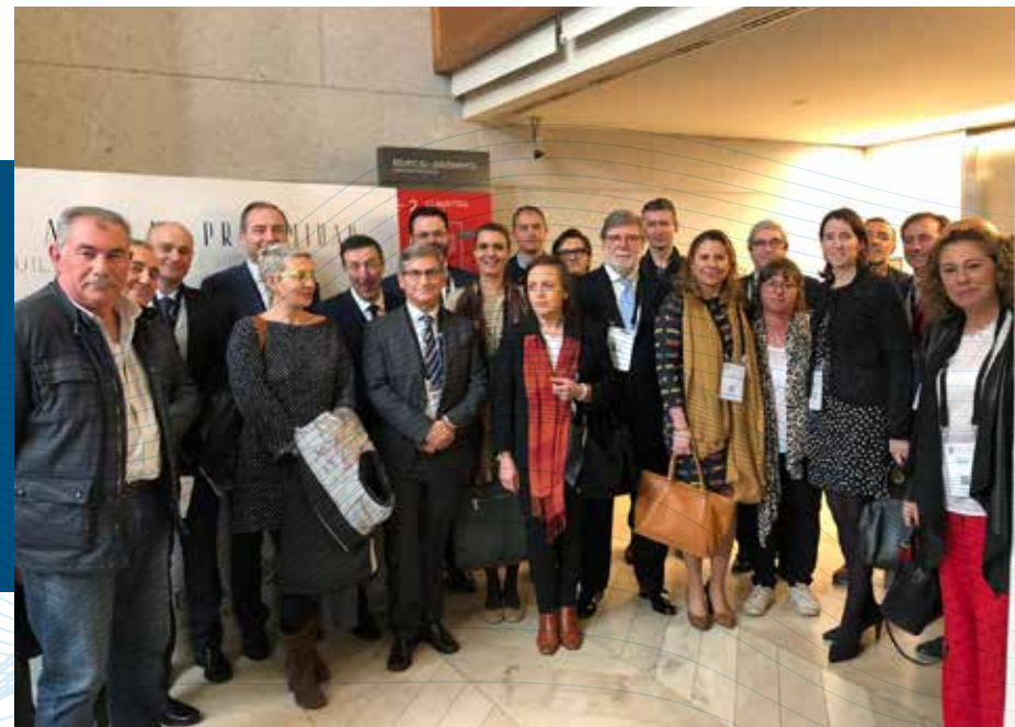
Celebración del 20 aniversario de ASEDAS