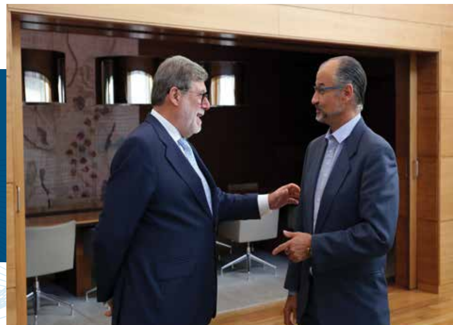
Primer encuentro institucional con el presidente de las Cortes de Castilla y León