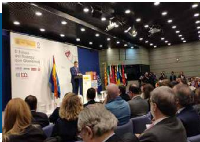
CECALE, en la II Conferencia Nacional Tripartita "El futuro del trabajo que queremos"