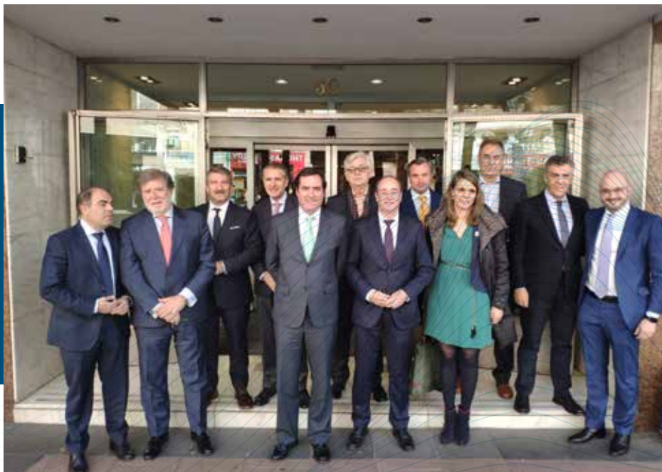
Garamendi recibe a la Junta Directiva de CECALE en CEOE