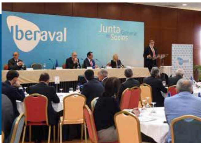
Santiago Aparicio presenta los resultados de Iberaval de 2018