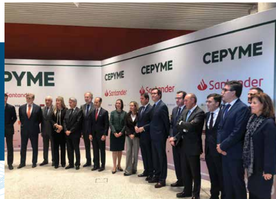
VI Edición de los Premios CEPYME