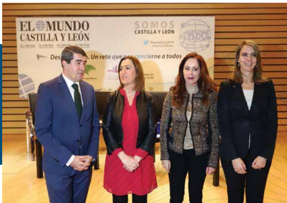
Foro “Despoblación. Un reto que nos concierne a todos”