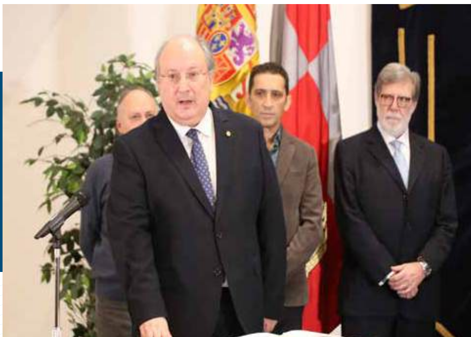
Toma de posesión del nuevo presidente del CES