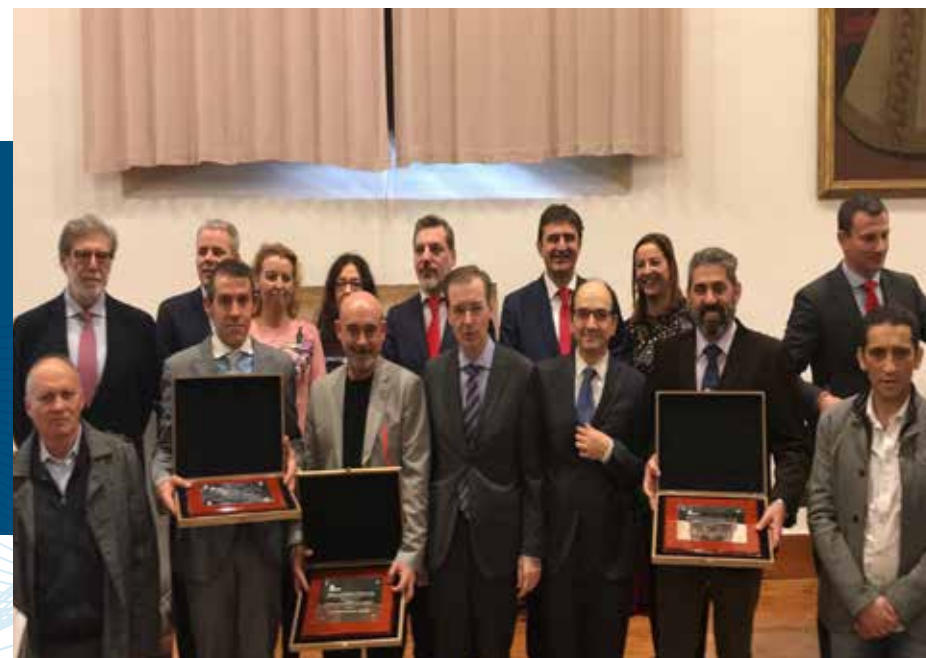
Premios de Prevención de Riesgos Laborales en Castilla y León