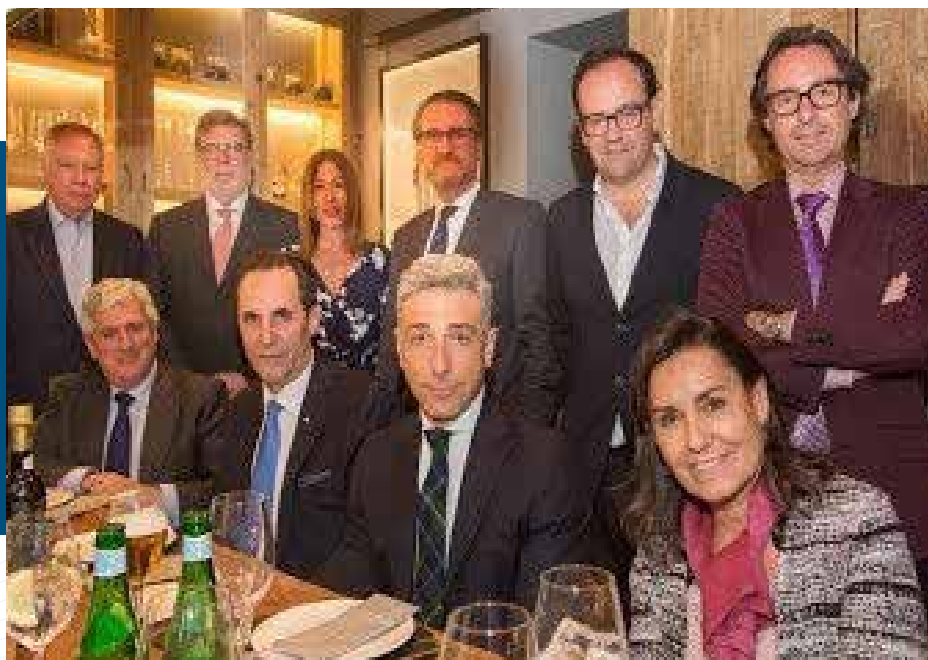
Consejo Asesor del Foro Guadarrama