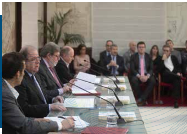
Apuesta por los jóvenes y el empleo en el Diálogo Social