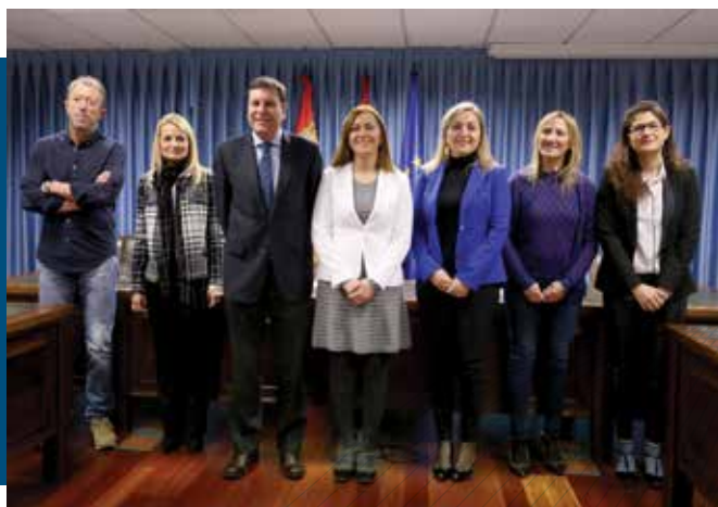
Compromiso con la prevención en seguridad vial laboral