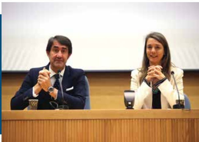
Jornada “Administración Electrónica: Residuos y permisos ambientales”