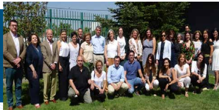
Apuesta por la Responsabilidad Social Corporativa