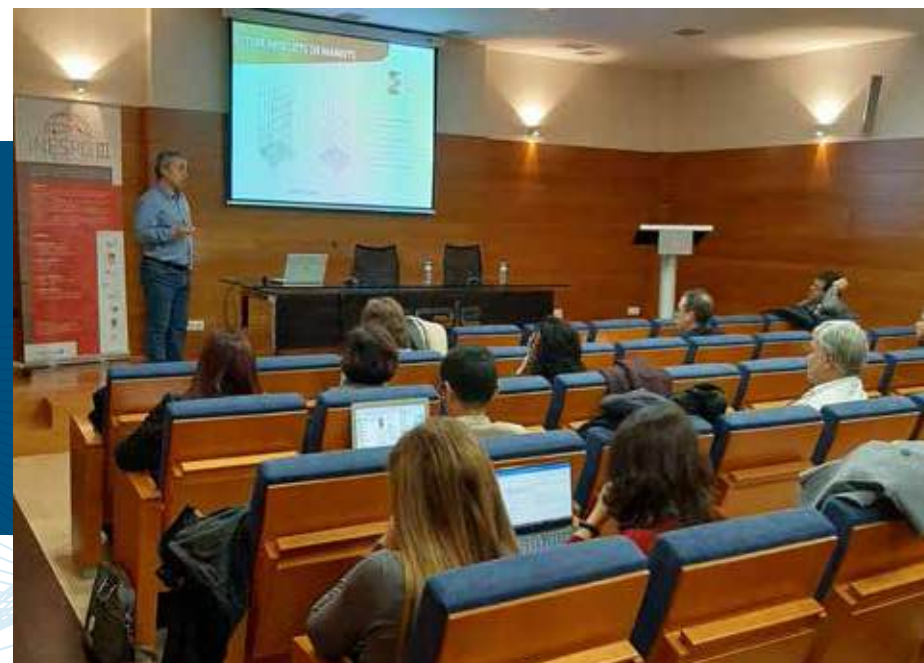
Presentación de los resultados del proyecto transfronterizo INESPO III