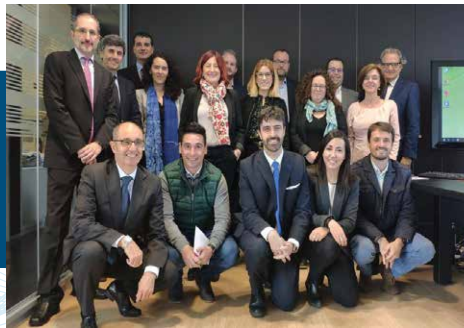
Patronato de la Fundación EXECYL