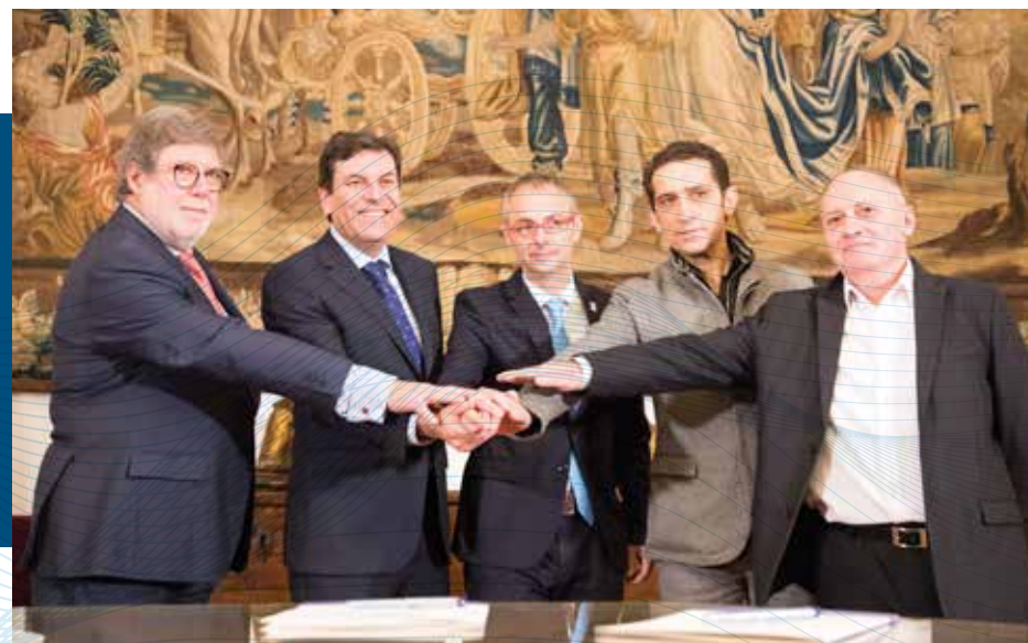
Impulso a la Cátedra de Prevención de Riesgos Laborales