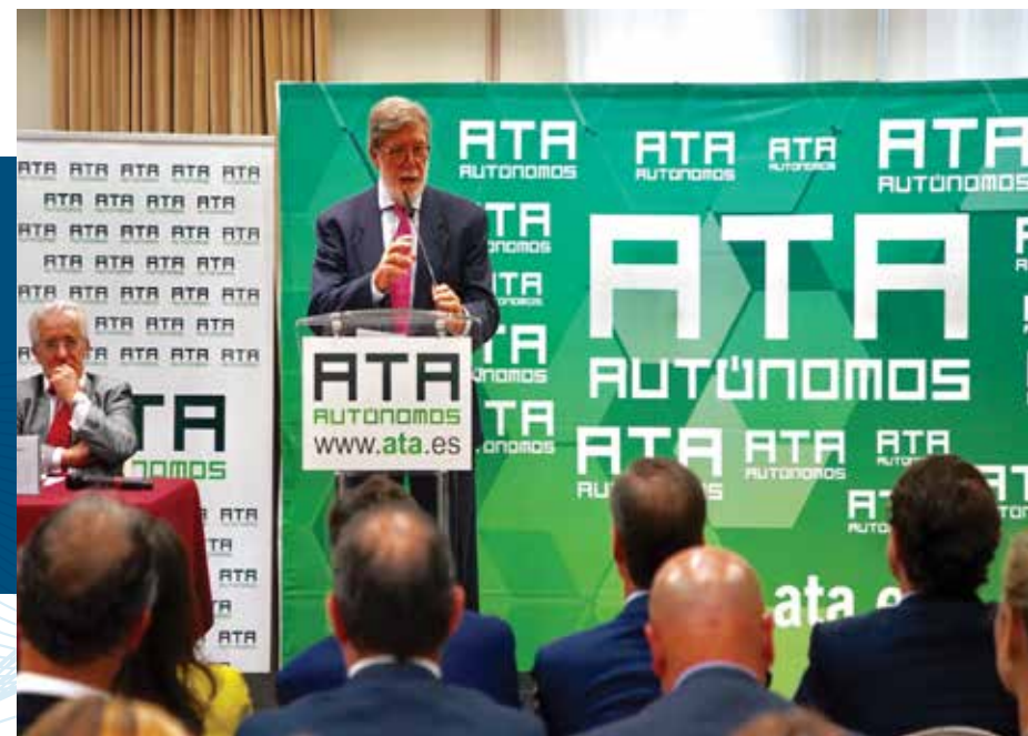
Clausura de la Asamblea Electoral de ATA Castilla y León