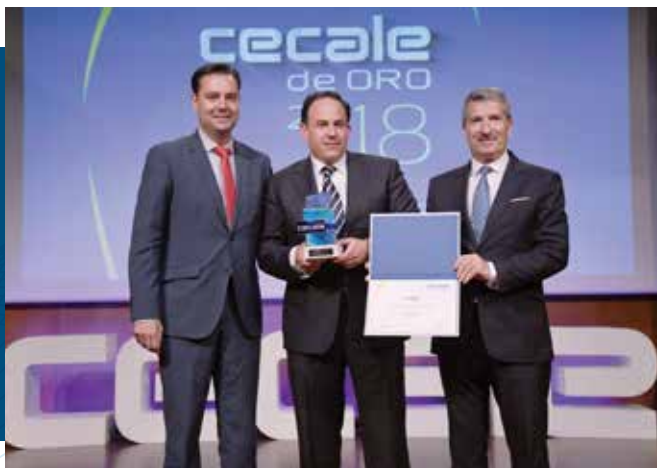
CECALE de Oro (Ávila)