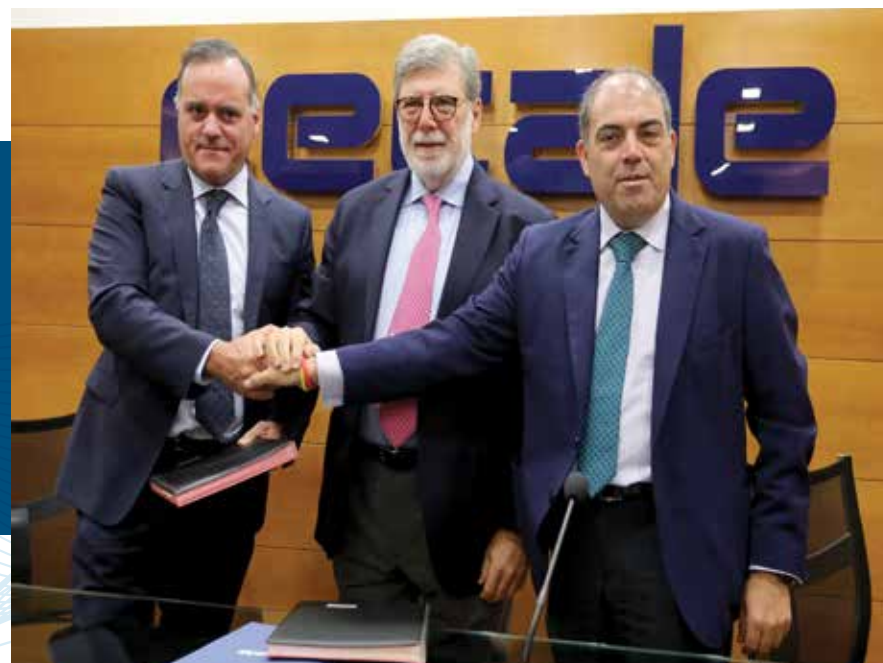
Importante acuerdo de integración de ATA Castilla y León en CECALE