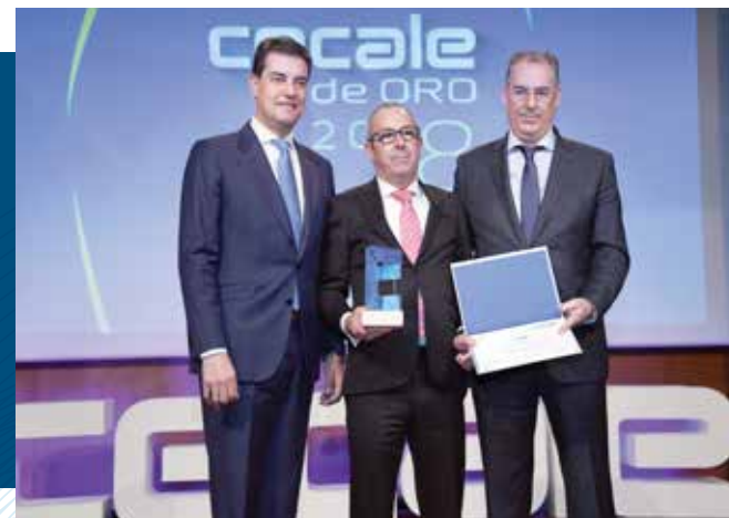
CECALE de Oro (Burgos)