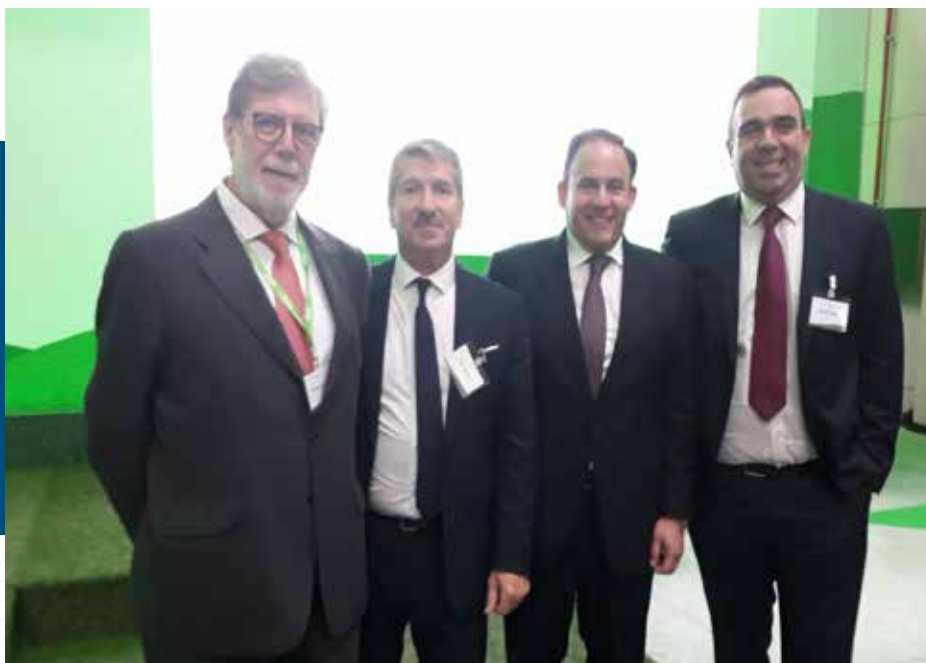
Inauguración de la nueva fábrica de Ornua en Ávila