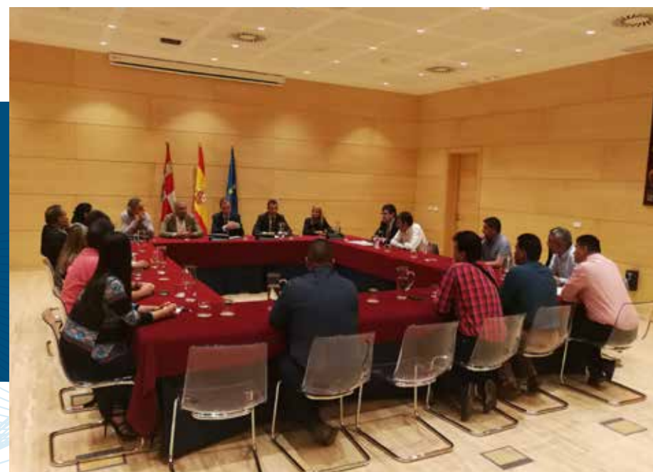
Una delegación de la Central Unitaria de Trabajadores "CUT" de Bocaya-Colombia conoce el modelo del Diálogo Social