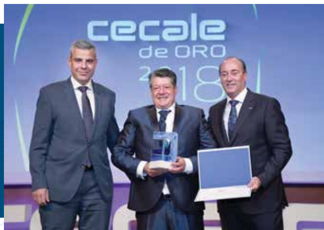
CECALE de Oro (Palencia)