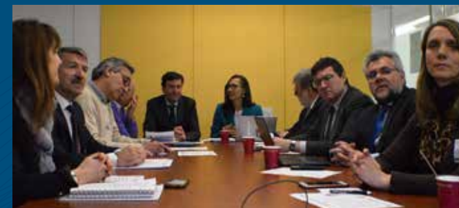
Delegación del Consejo de Diálogo Social en Washington