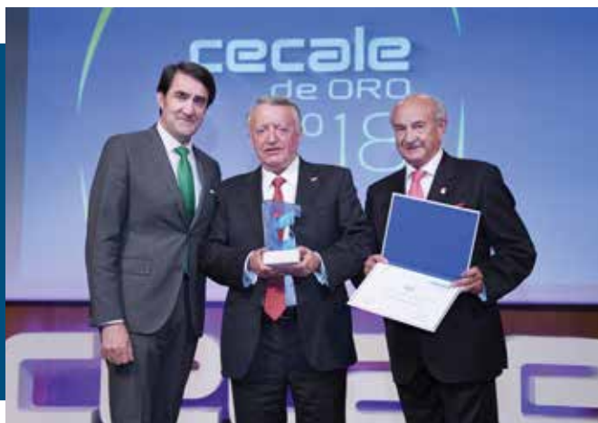
CECALE de Oro (León)