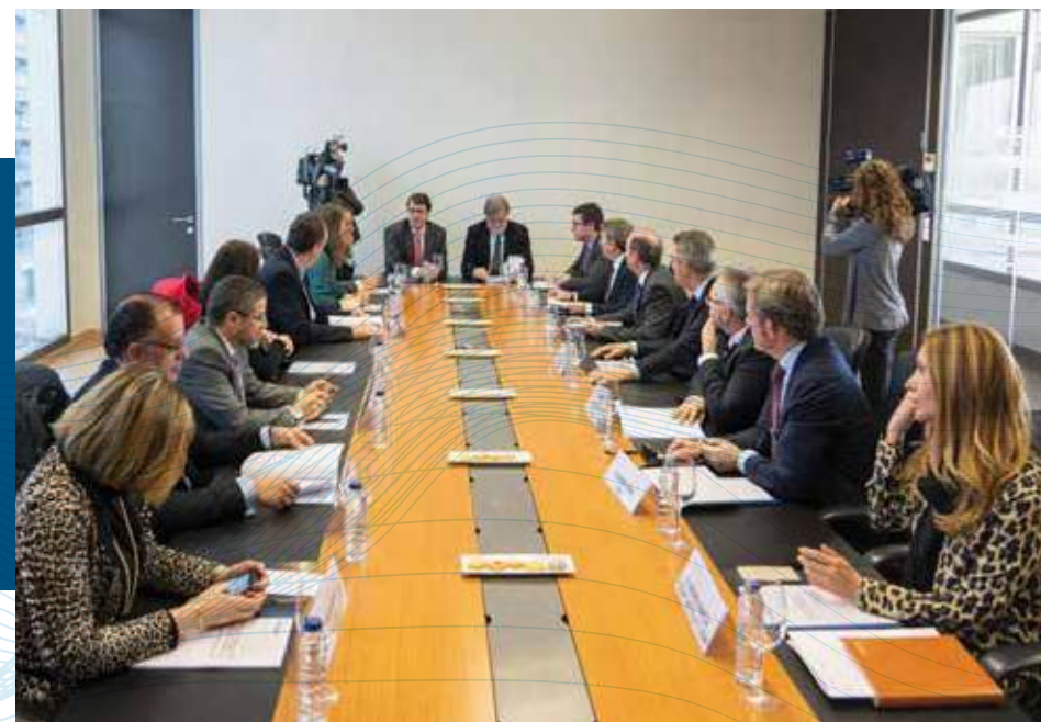
Encuentro con el presidente del PP Castilla y León