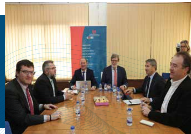
Junta Directiva de CECALe en la sede de CPOE