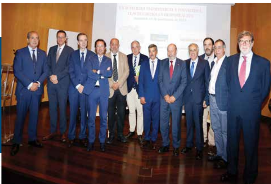
Jornada “La actividad empresarial y financiera. Claves contra la despoblación”