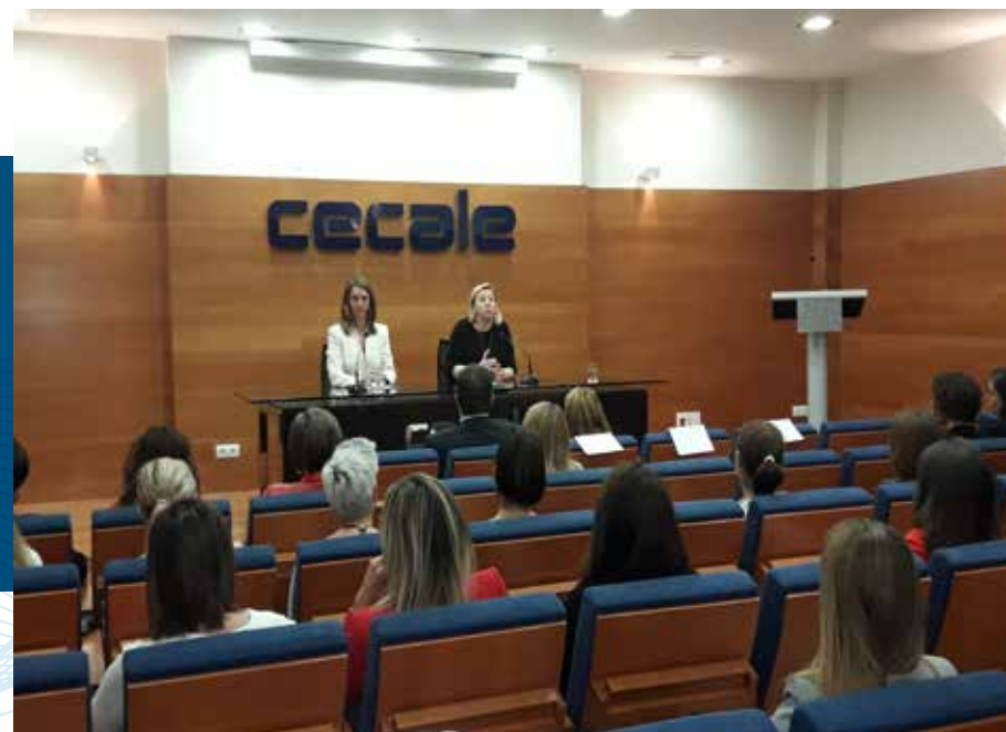
CPresentación del Programa “Mujer y Dirección”